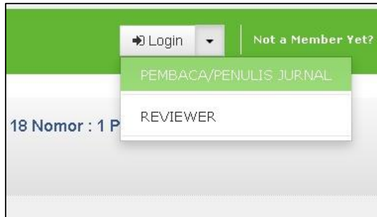
Gambar 3. Halaman Menu Login

Untuk dapat mengakses menu-menu pada sistem informasi gtJurnal, lakukan login terlebih dahulu.