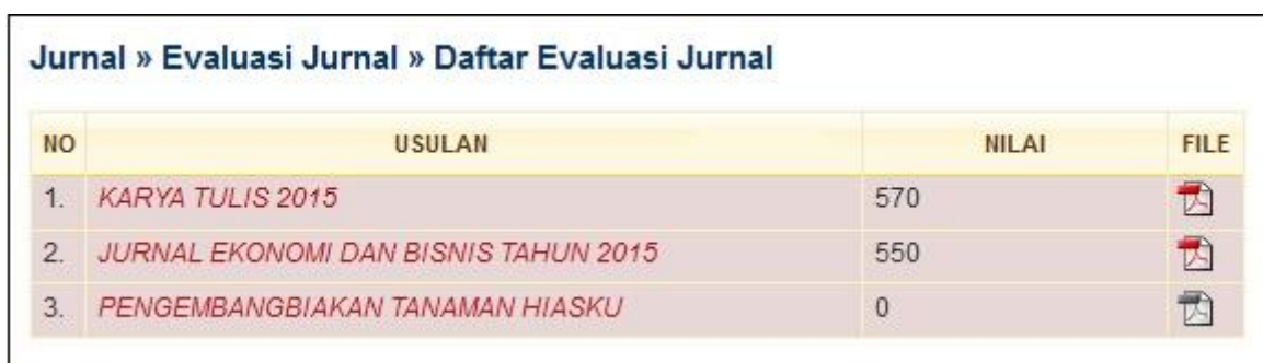
Gambar 3. Daftar Jurnal yang dinilai